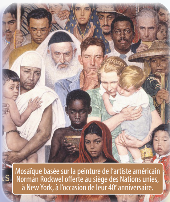
Mosaïque basée sur la peinture de l'artiste américain Norman Rockwell offerte au siège des Nations unies, à New York, à l'occasion de leur 40 e anniversaire.

Nous vous invitons à un partage interconvictionnel en visioconférence Zoom sur le thème :