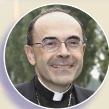
S. Em. le Cardinal Philippe BARBARIN

Nous lirons d'abord quelques textes sacrés sur le thème, puis des représentants de différentes traditions offriront leurs commentaires, notamment :