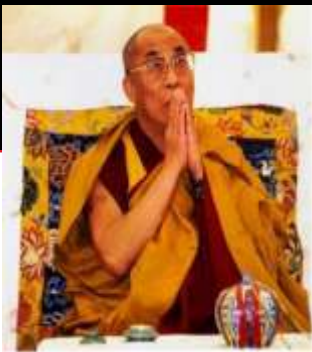
Il Dalai Lama

Anche i Buddhisti credono nella reincarnazione della vita.